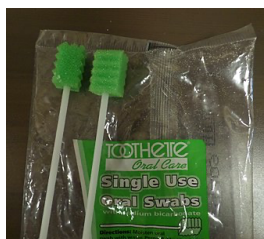
Esponja de higiene oral

Ashford, J. R. (2005, March). Pneumonia: Factors Beyond Aspiration. Perspectives in Swallowing and Swallowing Disorders (Dysphagia), 14, 10-16.